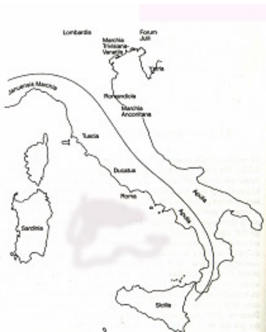
La divisione dialettale dell'Italia ( De vulgari eloquentia , I, X, 4-5). F.L. Palè (1927).